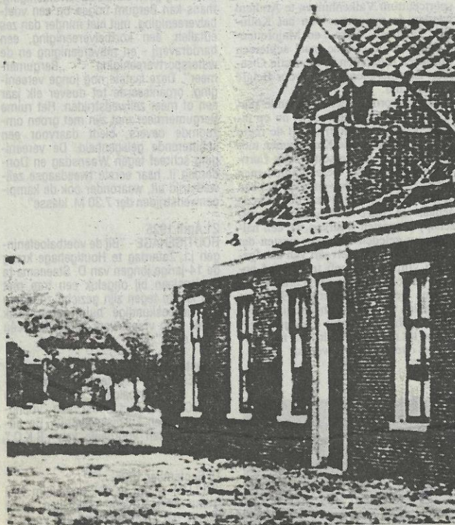
Foto van de herberg bij Kootstermolen.

Hoe verging het een kastelein zo ongeveer een eeuw geleden in het dorp Kooten (nu Kootstertille)? Dit artikel probeert een indruk te geven van de bedrijfsvoering en de dagelijkse gang van zaken. Er werd gebruikgemaakt van een notitieboek, waarin de vorderingen op de klanten werden opgeschreven. Dit boek is bij een kleindochter van de caféhouder bewaard gebleven.